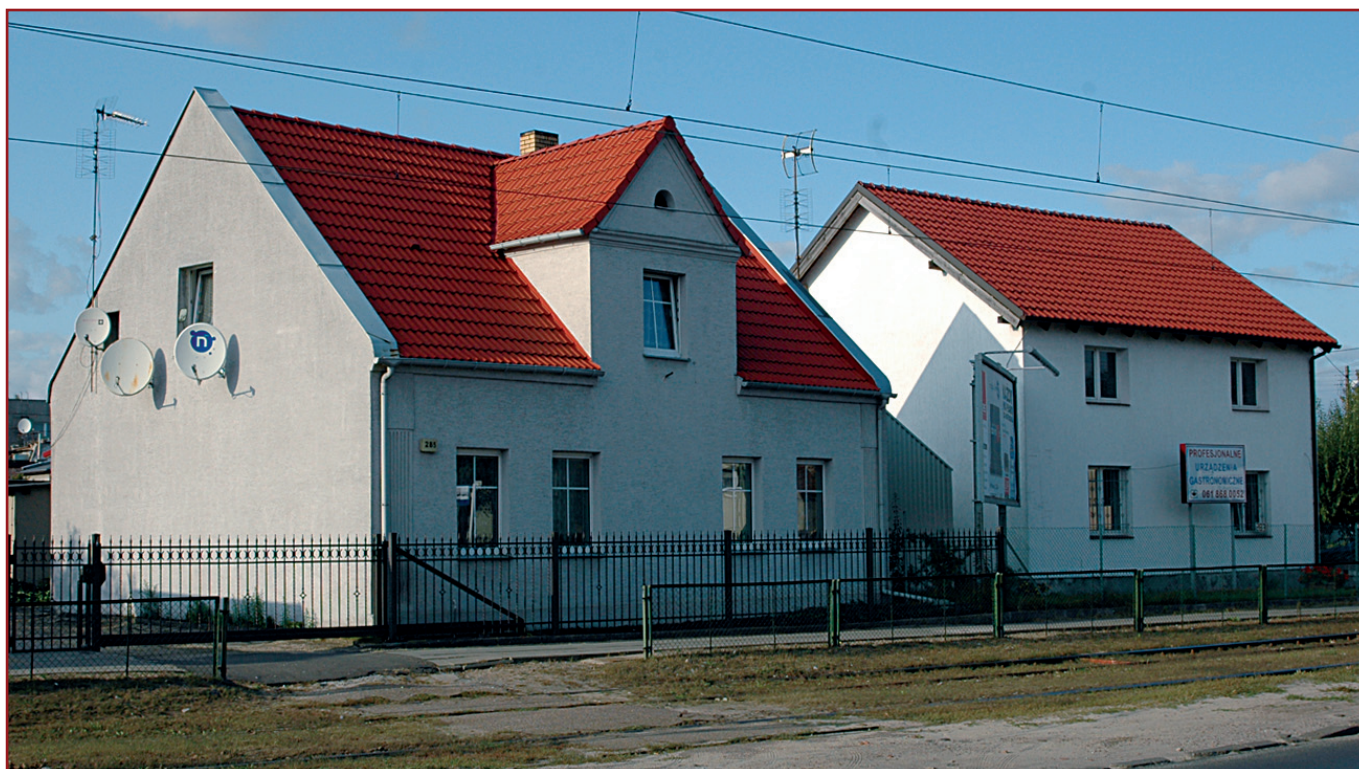
Budynki przy ul. Grunwaldzkiej przeznaczone do wyburzenia