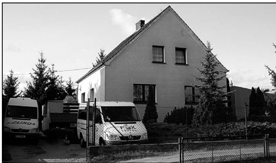
Odszkodowania za utracone w wyniku wywłaszczenia mienie są oburzająco niskie i nie pozwalają na odtworzenia stanu posiadania.